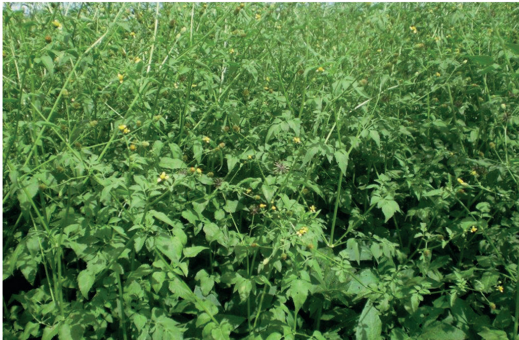
Figura 1. Área infestada com picão-preto resistente ao glifosato.

A partir dessa situação observada no campo, foram iniciados os estudos de comprovação da resistência em condições controladas. Inicialmente, foram coletadas plantas dos biótipos sobreviventes na área, colocadas em vasos plásticos de 10 L e levadas para a Embrapa Soja, em Londrina, PR. Na análise taxonômica das plantas, foi confirmada a identificação da espécie como sendo Bidens subalternans .